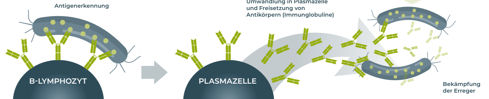
Abbildung nicht maßstabsgerecht