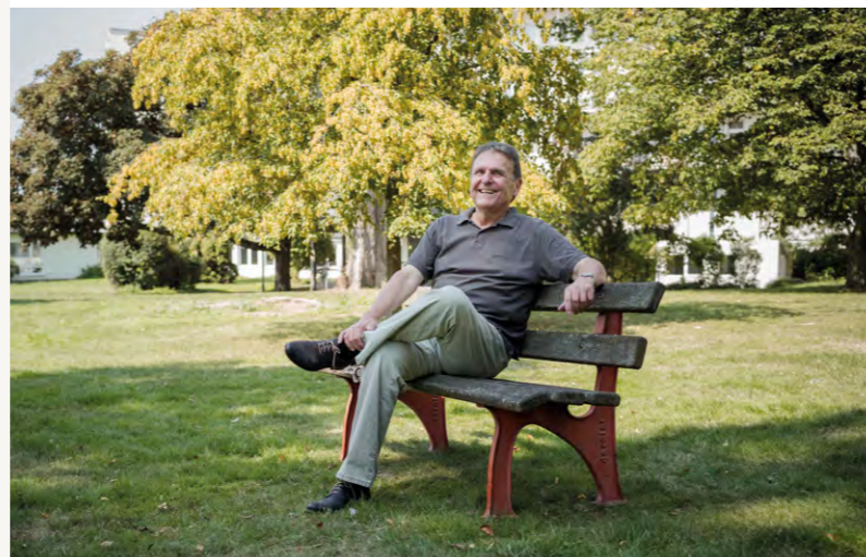
BERND: Das Immunsystem nach und nach stabilisieren